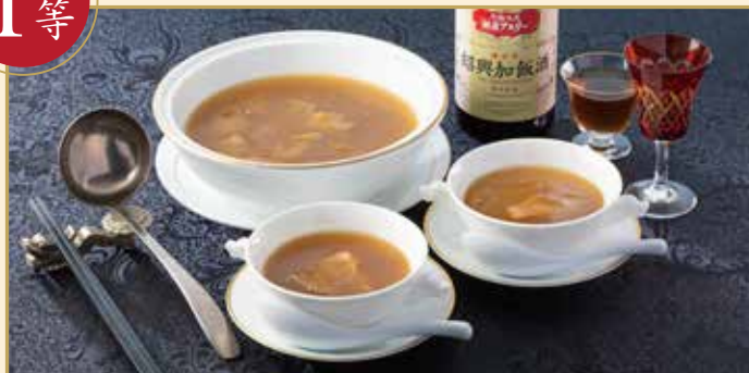
冷凍ギフト名菜中華「ふかのひれのスープセット」 税込 9,720円相当