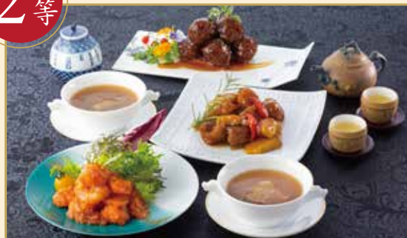
冷凍ギフト名菜中華「香蘭」 税込 8,640円相当