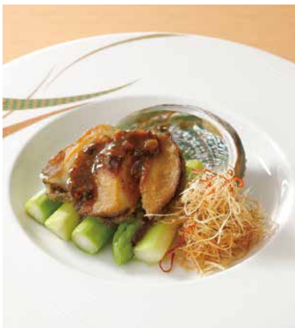
1. 豉汁煎鮑魚 ..... 1~2名様用 3,200 Sautéed abalone with fermented soy beans sauce (税込 3,520) 鮑のステーキ、豆豉ソース