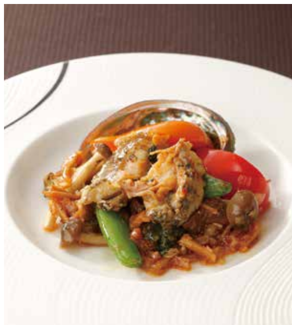
4. XO醬炒鮑魚 ..... 1~2名様用 3,200 Sautéed abalone with XO sauce (税込 3,520) 鮑と野菜のXO醬炒め