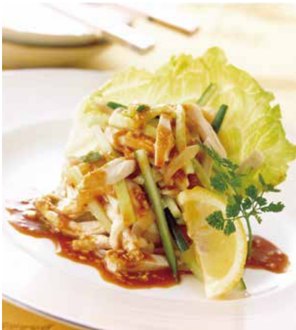
5. 棒棒鶏 ..... 1~2名様用 1,400 Cold chicken with jellyfish (Sesame sauce) (税込 1,540) バンバンジー (小麦)