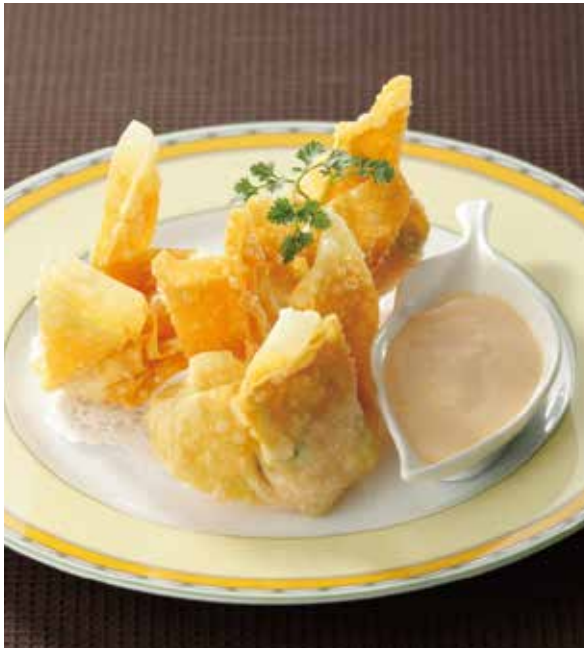
5. 炸蝦仁雲吞 ..... 4個 800 Fried shrimp wonton(mayonnase sauce) (税込 880) 揚げ海老ワンタン、 マヨネーズクリームソース添え 乳・卵・小麦・落花生・えび