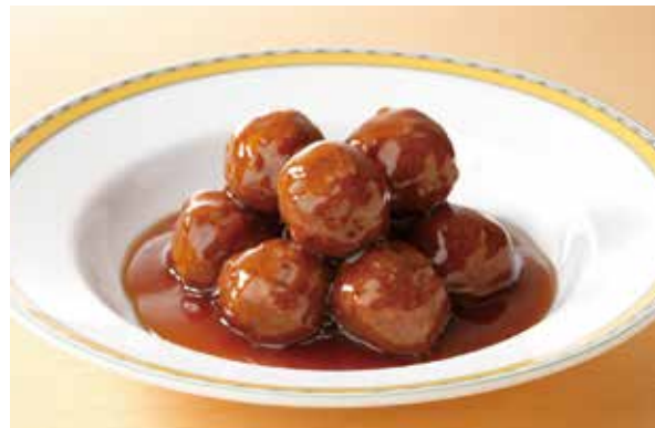
7. 糖醋丸子 ..... 2,000 Fried meat balls (Sweet sour sauce) (税込 2,200)