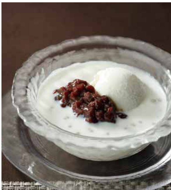
2. 西米奶露雪糕 ..... 900 Coconut milk with tapioca and ice cream (税込 990) (fruit or red beans)