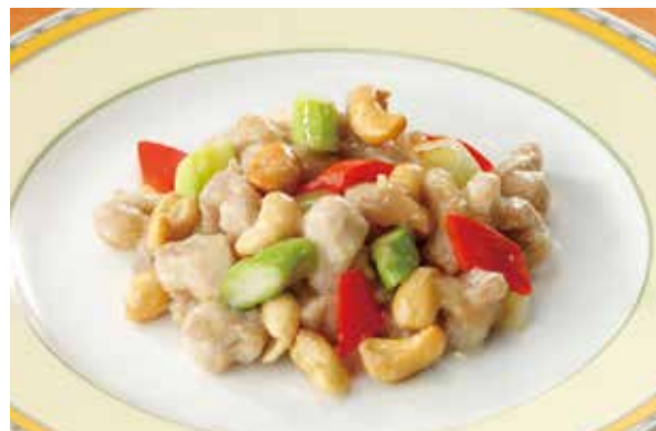
8. 腰果炒鶏丁 ..... 2,100 Sautéed chicken and cashew nuts (税込 2,310)