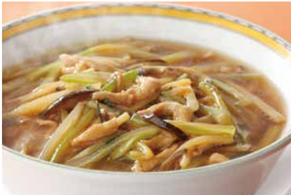
4. 芹菜湯麵 ..... 2,100 Soup noodles with celery and pork (税込 2,310)