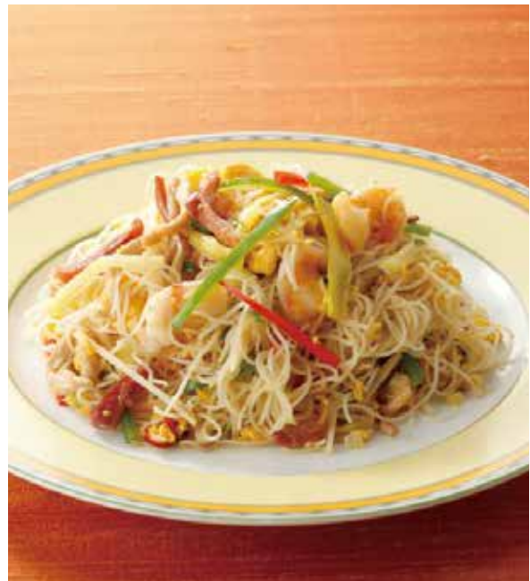
8. 福建米粉 ..... 2,000

Rice-flour noodles with pork and vegetables (税込 2,200)