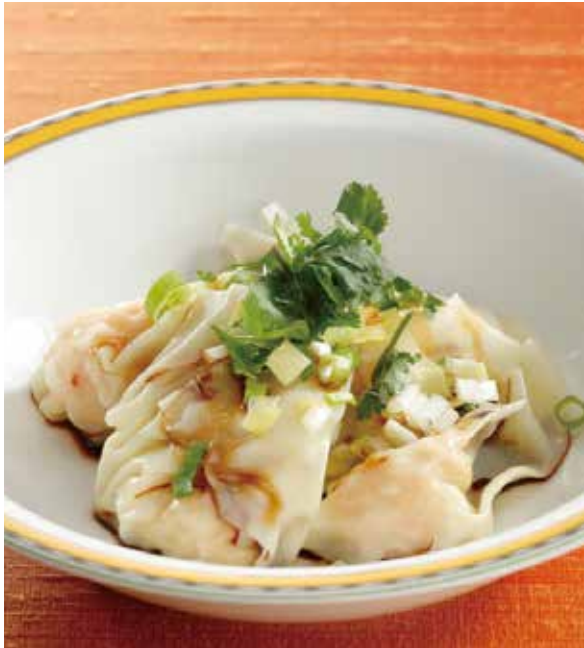
3. 蒸蝦仁雲吞 ..... 4個 800 Steamed shrimp wonton (税込 880) 蒸し海老ワンタン、香味醤油がけ 卵・小麦・落花生・えび