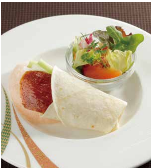
1. 北京烤鴨 ..... 1切 1,000 Roasted peking duck with salad (税込 1,100)