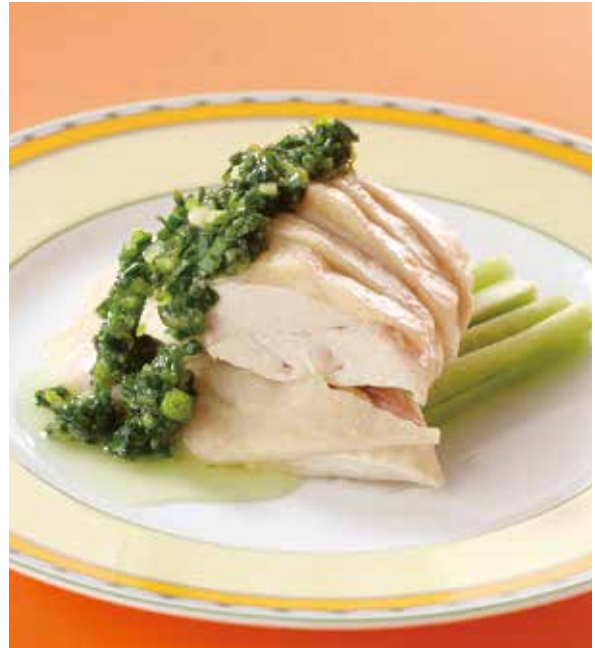
4. 広東白切鶏 ..... 1~2名様用 1,400 Cold chicken (Ginger scallion sauce) (税込 1,540) 蒸し鶏、葱生姜ソース (小麦)