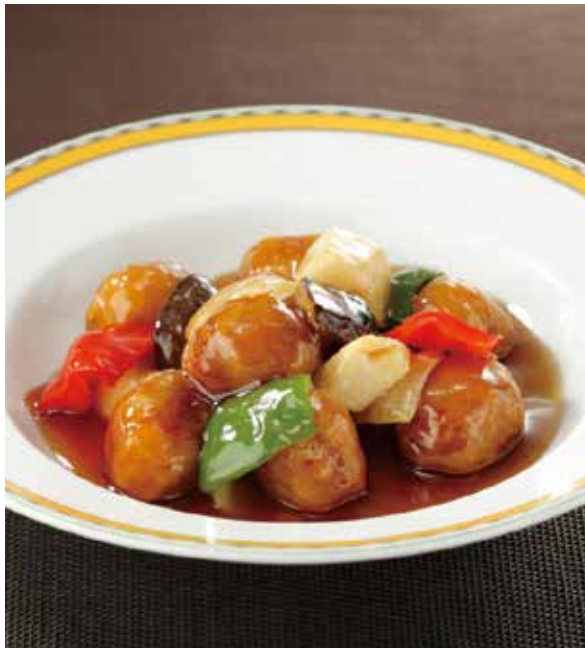
5. 糖醋里脊 ..... 2,300 Sweet sour pork (税込 2,530)