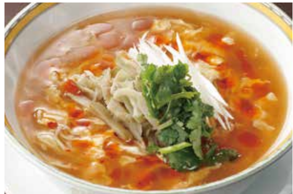
7. 酸辣湯麵 ..... 1,900 Hot and sour soup noodles (税込 2,090)