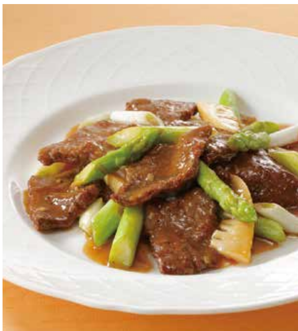
3. 蠔油龍鬚牛肉 ..... 2,700 Sautéed beef and asparagus (税込 2,970)