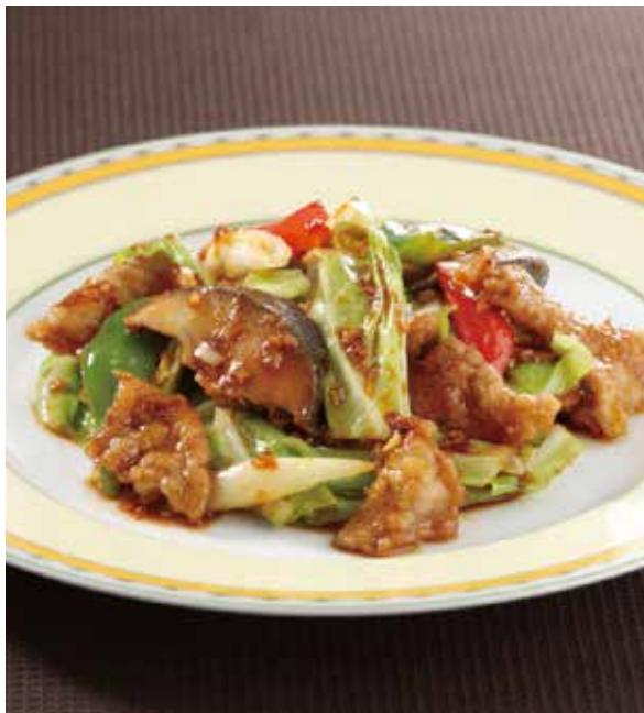
6. 回鍋肉 ..... 2,100 Sautéed pork and cabbage (税込 2,310)