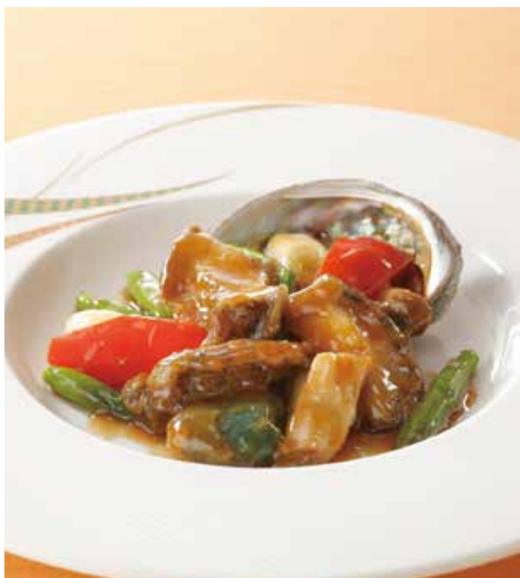
3. 蠔油炒鮑魚 ..... 1~2名様用 3,200 Sautéed abalone with oyster sauce (税込 3,520) 鮑と野菜のオイスターソース炒め