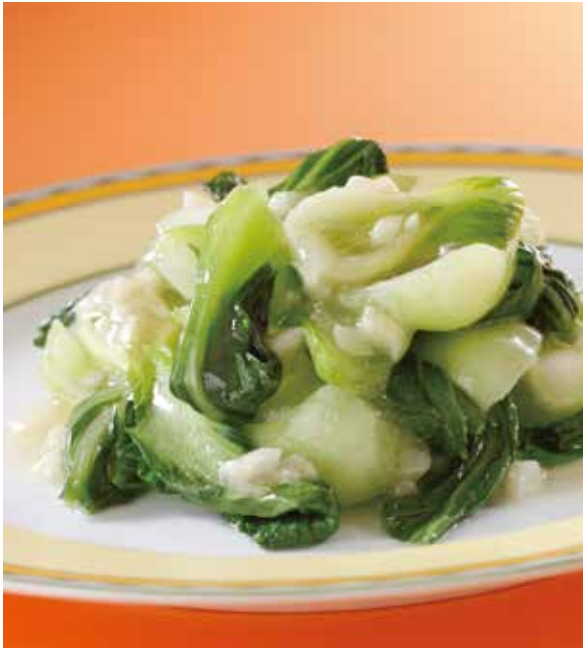
1. 橄欖油炒蔬菜 ..... 1,900 Sautéed vegetables (Extra virgin olive oil) (税込 2,090) 青野菜のエクストラバージンオリーブオイル炒め