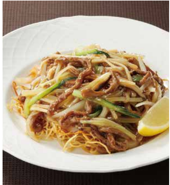
2. 広東炒麵 ..... 2,200 Fried noodles with beef and celery (税込 2,420)