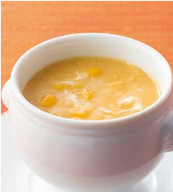
3. 包米湯 ..... 1名様用 1,000 Corn soup (税込 1,100) コーンスープ