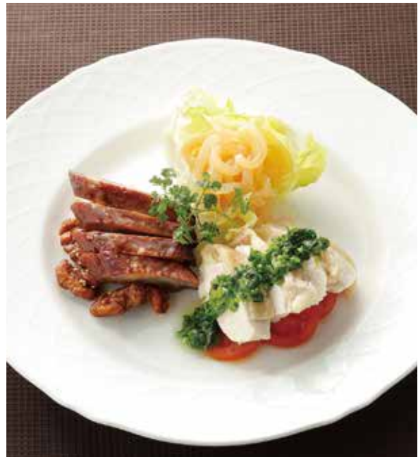
2. 三拼盤 ..... 3,000 Three kinds of appetizer 三種前菜盛り合わせ (税込 3,300)