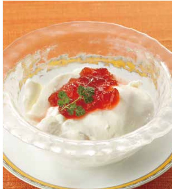
5. 鮮奶豆腐 ..... 800 Soft almond jelly (税込 880) コラーゲン入りやわらか杏仁 ※フルーツジュレは季節替わりでご用意しております。 (乳)