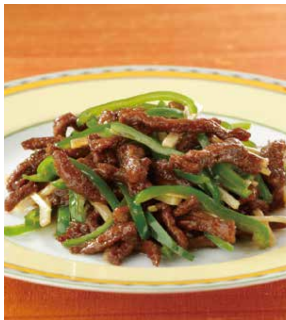
4. 青椒牛肉絲 ..... 2,700 Sautéed beef and pimiento (税込 2,970)