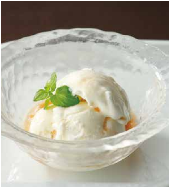
6. 雪糕 ..... 800 Coconut milk ice cream (税込 880) コラーゲン入りココナッツアイスクリーム (乳)