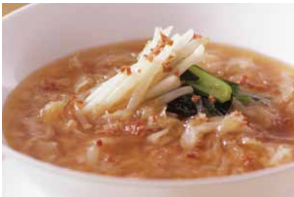
9. 魚翅泡飯 ..... 4,000 Boiled rice in shark's fin soup (税込 4,400) ふかのひれのスープかけご飯