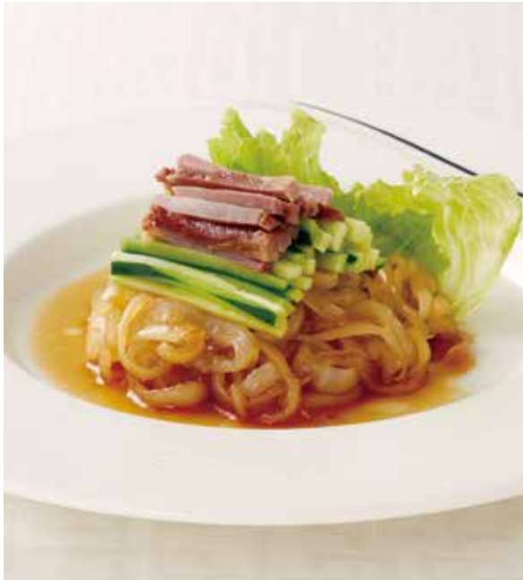
3. 拌海蜇皮 ..... 1~2名様用 2,300 Jellyfish in vinegar (税込 2,530) くらげの甘酢和え (小麦)