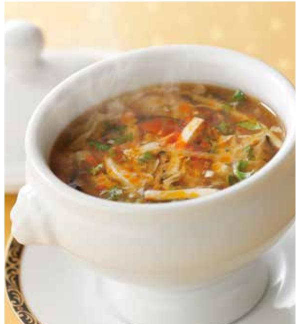
4. 酸辣湯 ..... 1名様用 1,000 Hot and sour soup (税込 1,100) サンラータン