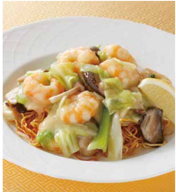
4. 時菜蝦仁炒麵 ..... 2,100 Fried noodles with shrimp and vegetables (税込 2,310)