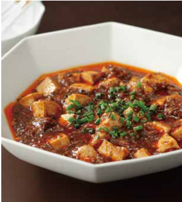
5. 陳麻婆豆腐 ..... 2,200

Spicy braised tofu and minced beef (Very hot) (税込 2,420)