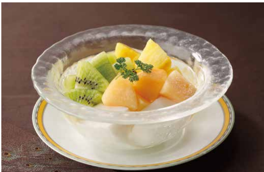
1. 鮮果杏仁豆腐 ..... 900 Almond jelly with fruit cocktail (税込 990)