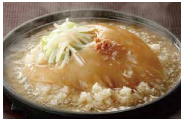
10. 紅焼排翅飯 ..... 18,000 Braised whole shark's fin rice (税込 19,800) ふかのひれの姿煮込みの あんかけご飯 ..... ハーフ 9,000 (税込 9,900)