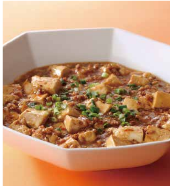
6. 麻婆豆腐 ..... 2,100

Spicy braised tofu and minced pork (税込 2,310)