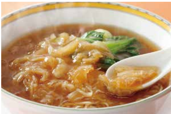
8. 魚翅麵 ..... 5,500 Soup noodles with braised shark's fin (税込 6,050)