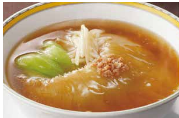
9. 排翅麵 ..... 18,000 Soup noodles with braised whole shark's fin (税込 19,800)