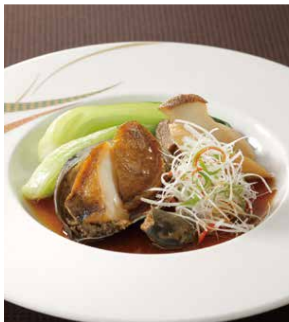
2. 葱油原殻鮑魚 ..... 1~2名様用 3,200 Steamed abalone with scallion sauce (税込 3,520) 鮑の葱風味蒸し、香味醤油ソース