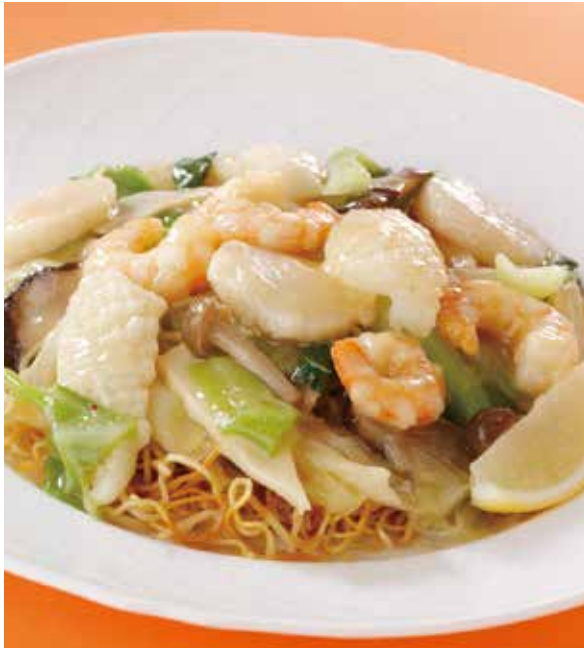
1. 海鮮炒麵 ..... 2,500 Fried noodles with seafood (税込 2,750)