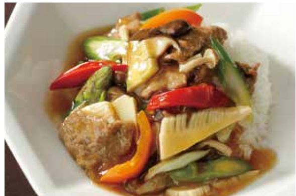
8. 牛肉燴飯 ..... 2,200 Beef and vegetables sauté served on rice (税込 2,420) 牛肉と野菜のあんかけご飯