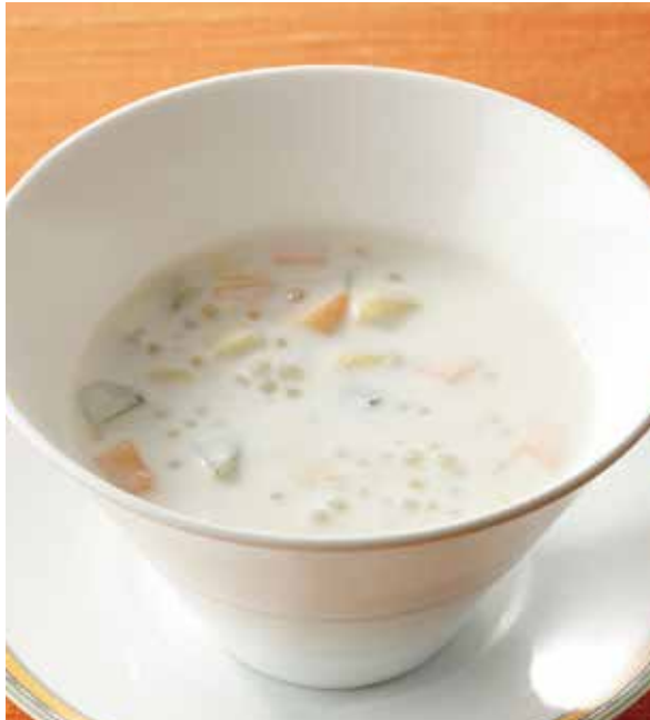
4. 西米奶露 ..... 800 Coconut milk with tapioca (fruit or red beans) (税込 880) タピオカのココナッツミルク ※お選びください。①フルーツ ②小豆 (乳)