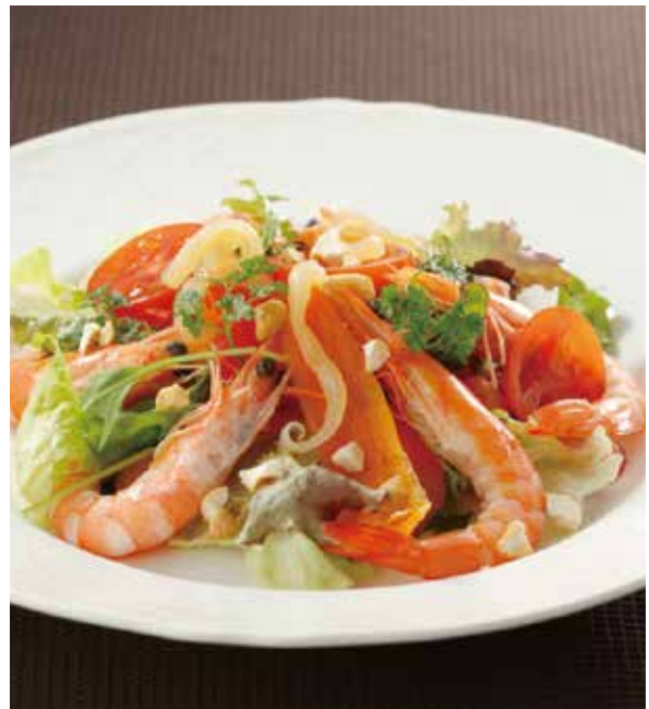
6. 沙律蝦 ..... 1~2名様用 2,100 Prawn and nuts salad (税込 2,310) 海老とナッツと野菜のサラダ (小麦・えび)