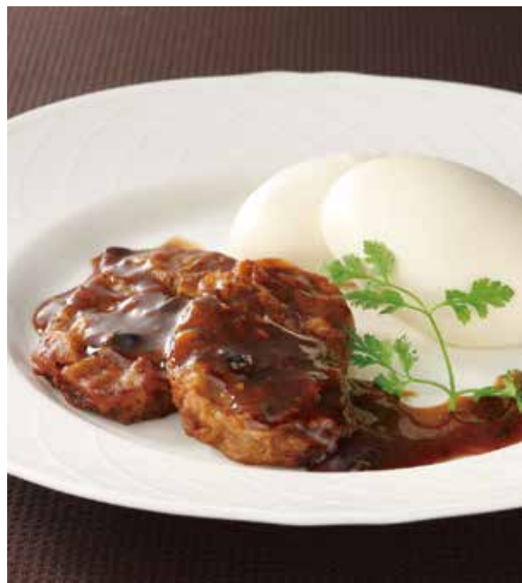
2. 豉椒牛里脊 ..... 2切 2,000 Sautéed beef with fermented soy beans (税込 2,200)