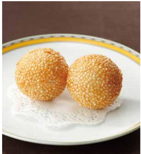
7. 炸芝麻球 ..... 2個 600 Deep fried sweet dumpling with sesame seed (税込 660) あん入り揚げ胡麻団子 ※ご追加は一個単位で承ります。 (卵・小麦・落花生)