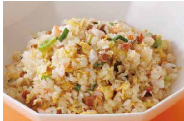
6. 什錦炒飯 ..... 2,000 Fried rice with pork, shrimp and vegetables (税込 2,200) 炒飯