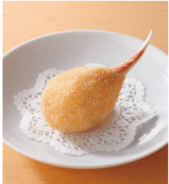
6. 百花釀蟹钳 ..... 1本 1,100 Fried stuffed crab claw (税込 1,210) 蟹の爪の広東風揚げ物 卵・小麦・落花生・えび・かに