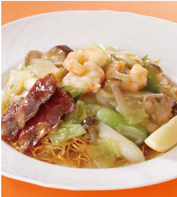
3. 什錦炒麵 ..... 2,000 Fried noodles with pork and vegetables (税込 2,200)