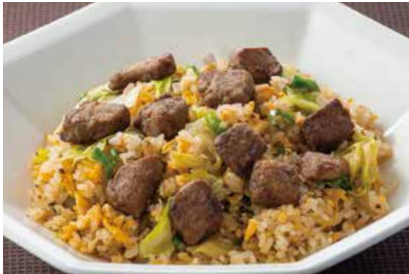
5. 牛肉生菜炒飯 ..... 2,500 Fried rice with beef and lettuce (税込 2,750) 牛フィレ肉とレタスの炒飯