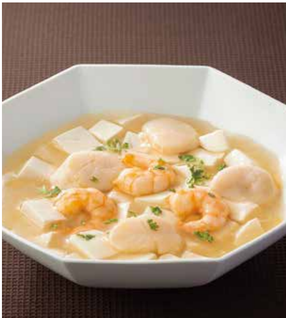
7. 双鮮豆腐 ..... 2,400

Braised tofu with scallop and shrimp (税込 2,640)