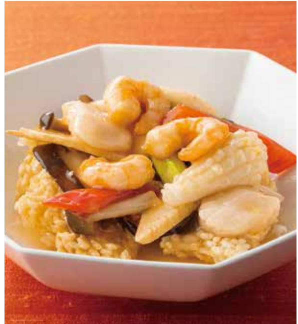
2. 海鮮鍋粿 ..... 2,500 Sautéed seafood served on crisp rice (税込 2,750) 海の幸のおこげ料理