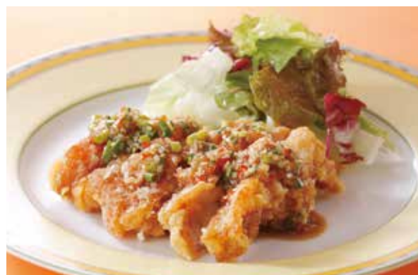
9. 油淋鶏 ..... 2,200 Fried chicken (Salty sweet sauce) (税込 2,420)