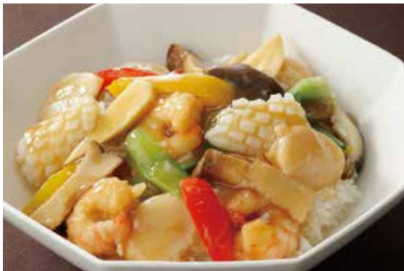
7. 海鮮燴飯 ..... 2,400 Sautéed seafood served on rice (税込 2,640) 海の幸と野菜のあんかけご飯