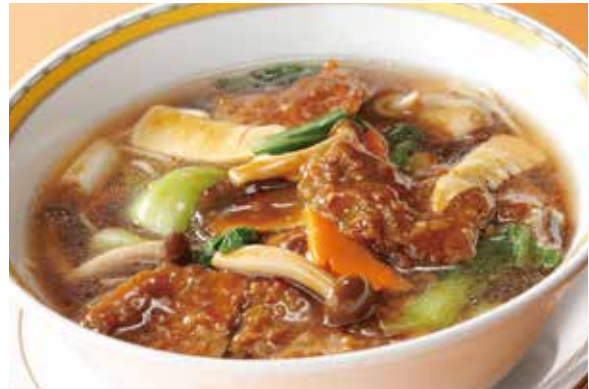
5. 牛肉湯麵 ..... 2,100 Soup noodles with beef and vegetables (税込 2,310)