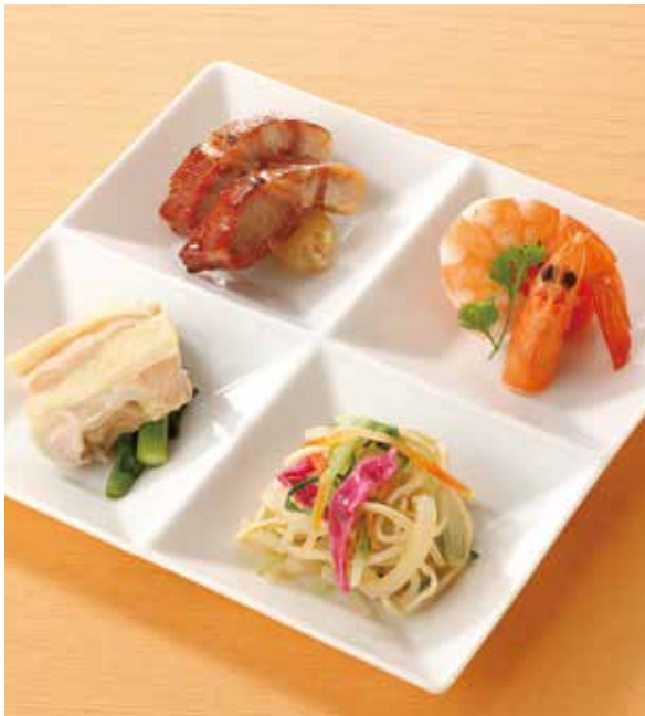
1. 什錦小拼盤 ..... 1名様用 1,400 Chef's special appetizer 前菜四種盛り合わせ (税込 1,540)