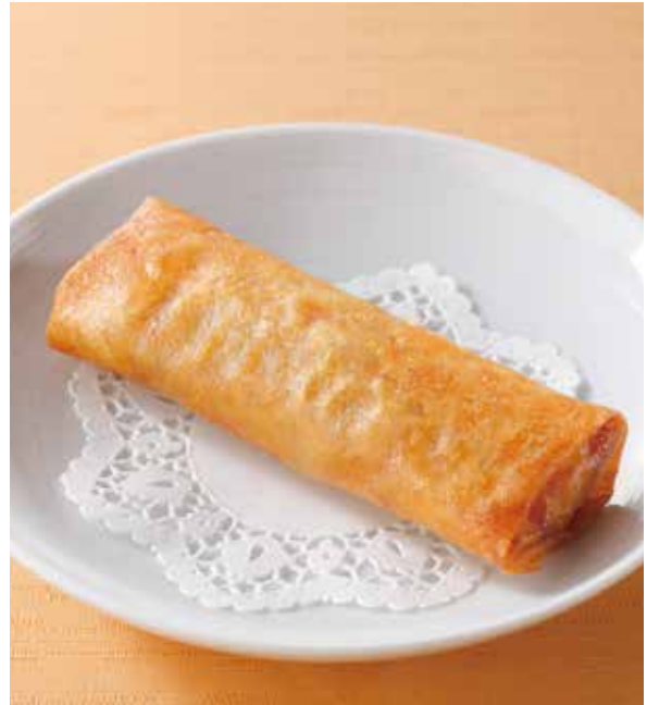
4. 炸春卷 ..... 1本 400 Spring rolls (税込 440) 春巻 卵・小麦・落花生