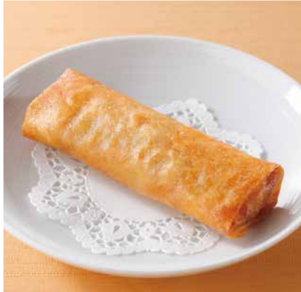
4. 炸春卷..... 1本 400 Spring rolls (税込 440)

蟹の爪下肉のまわりに海老のすり身を巻き、香ばしく揚げました。 時代を超えてお客様の人気を集める名物点心です。