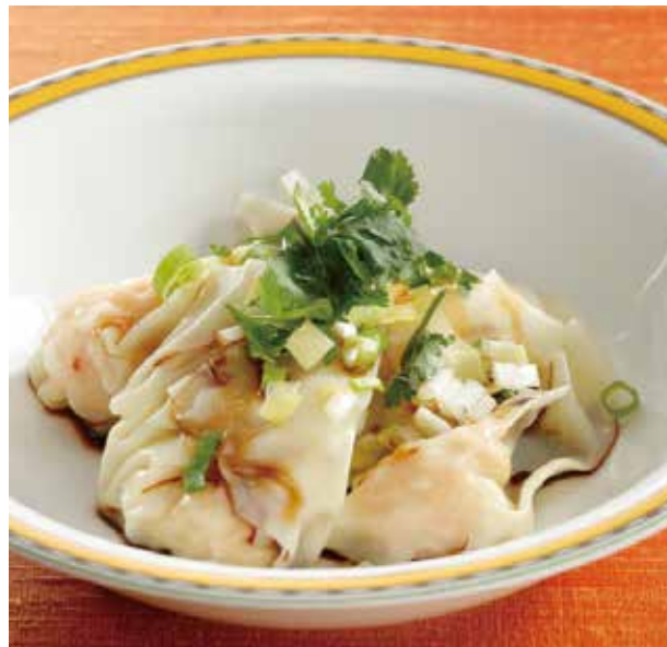
6. 蒸蝦仁雲吞..... 4個 800 Steamed shrimp wonton (税込 880)

カリッと香ばしく揚げた海老ワンタンを まろやかなマヨネーズクリームソースでお召し上がりください。