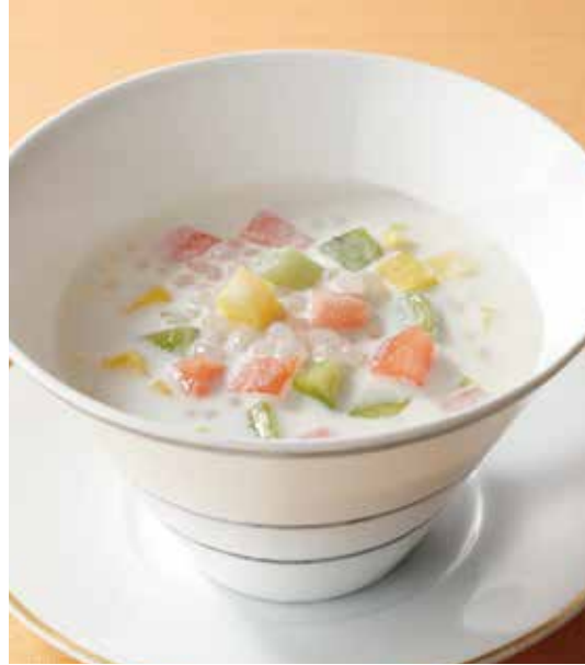
6. 西米奶露 ..... 800 (税込 880) Coconut milk with tapioca (fruit or red beans) タピオカのココナッツミルク ※フルーツまたは小豆からお選びください。