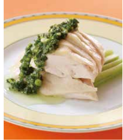
7. 白切鶏 1,500 (税込 1,650) Cold chicken 蒸し鶏 広東式葱生姜ソース Ginger scallion sauce 北京式香味醤油ソース Scallion soy sauce