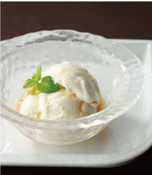
7. 雪糕 ..... 800 (税込 880) Coconut ice cream コラーゲン入りココナッツアイスクリーム 海洋性コラーゲンをプラスしたまろやかな味わいの アイスクリームです。