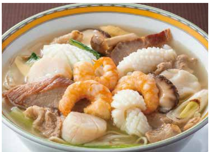
2. 什錦湯麺 ..... 2,500 (税込 2,750)

アスター麺は昭和33年生まれ。ブレンドした秘伝の味噌を使った濃厚でまろやかな味わいが人気です。