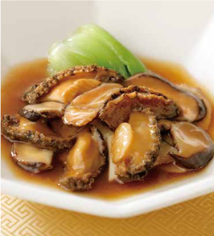
4. 蠔油蘑菇鮑魚 --- 5,200 (税込 5,720) Braised abalone and mushrooms (Oyster sauce) 鮑ときのこのオイスターソース煮