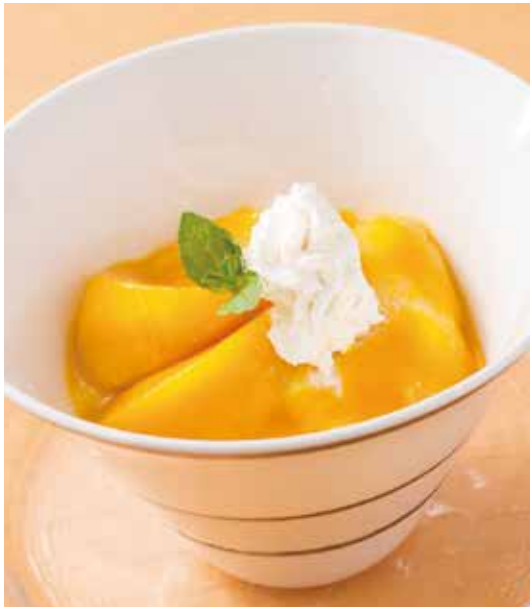
1. 香粧布丁 ..... 1,100 (税込 1,210) Mango pudding マンゴープリン マンゴーの果肉を使い、フルーティーな香りととろける食感が人気です。