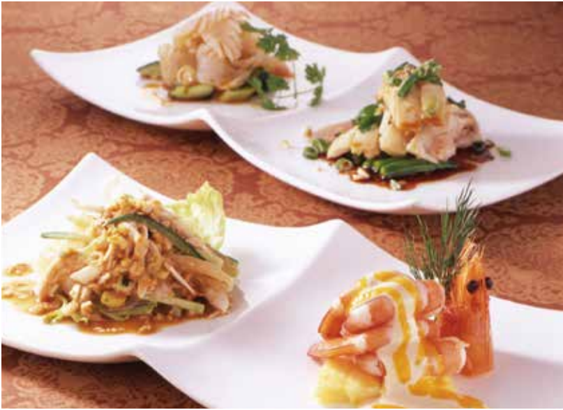
4. 喜好双拼 Two kinds of appetizer ----- 2,000 (税込 2,200)