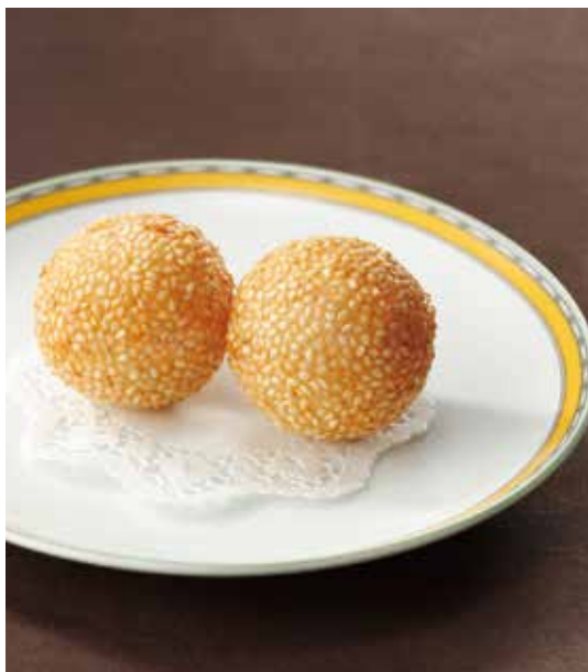
8. 炸芝麻球 ..... 1個 300 (税込 330) Deep fried sweet dumpling with sesame seed あん入り揚げ胡麻団子 あずきあんを包み香ばしく揚げました。 追加は一個単位で承ります。