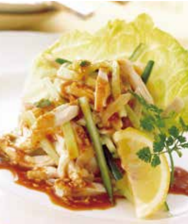
5. 棒棒鶏 2,000 (税込 2,200) Cold chicken with jellyfish (Sesame sauce) バンバンジー