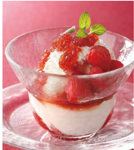
2. 杏仁巴飛 ..... 1,000 (税込 1,100) Soft almond jelly parfait やわらか杏仁とフルーツジュレのパフェ 季節のフルーツ、フルーツジュレとともに楽しむ アジアデザートです。フルーツジュレは季節変わりです。