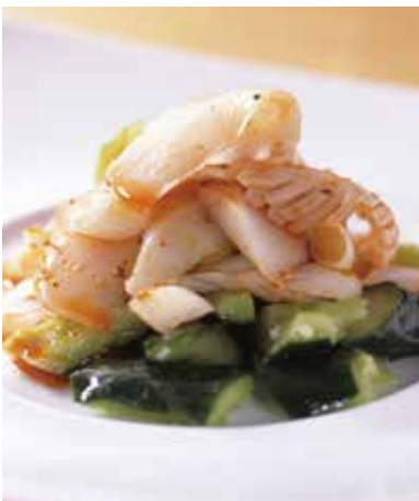
8. 麻辣魷魚 ----- 1,600 Cold cuttlefish (税込 1,760) (Hot pepper sauce) いかの四川式辛味和え