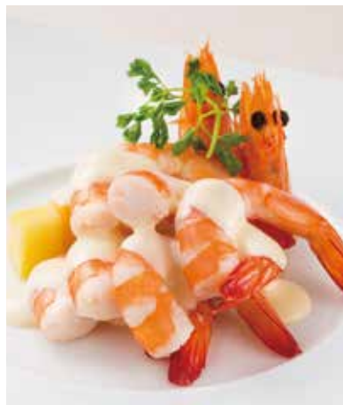
9. 沙律中蝦 ----- 1,600 Prawn salad (税込 1,760) (Cream sauce) 海老のクリームソース