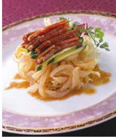
6. 拌海蜇皮 2,000 (税込 2,200) Jellyfish (Sweet vinegar) くらげの甘酢和え