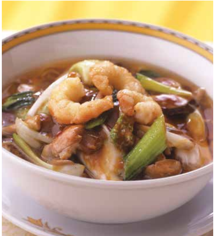
1. 亜寿多麺 ..... 2,000 (税込 2,200)