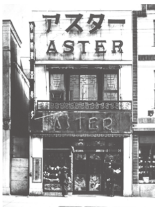
創業店舗(1926年 銀座一丁目)