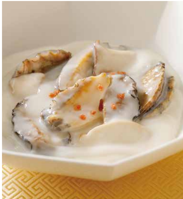
5. 奶油蘑菇鮑魚 --- 5,200 (税込 5,720) Braised abalone and mushrooms (Cream sauce) 鮑ときのこのクリーム煮