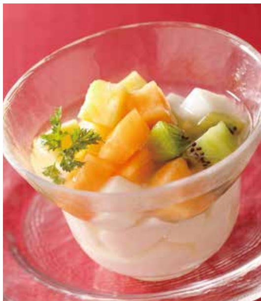
3. 鮮果杏仁豆腐 ..... 900 (税込 990) Almond jelly with fruit cocktail フルーツたっぷりの杏仁豆腐 香りとまろかやかさにこだわったオリジナルレシピの杏仁豆腐です。フルーツは季節変わりです。