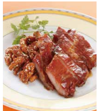
10. 蜜汁叉烧肉 ----- 1,500 Roasted pork (税込 1,650) 豚肉の蜜漬け香り焼き