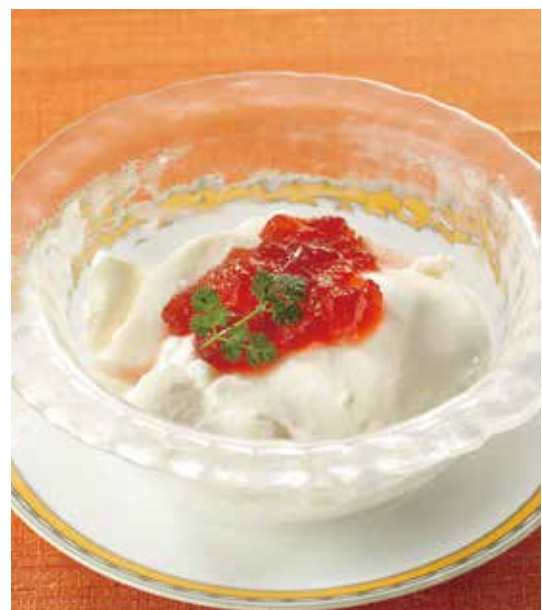
4. 美人杏仁豆腐 ..... 800 (税込 880) Soft almond jelly with fruit sauce コラーゲン入りやわらか杏仁 コラーゲンの入ったなめらかな舌触りの杏仁豆腐。 フルーツジュレは季節変わりです。