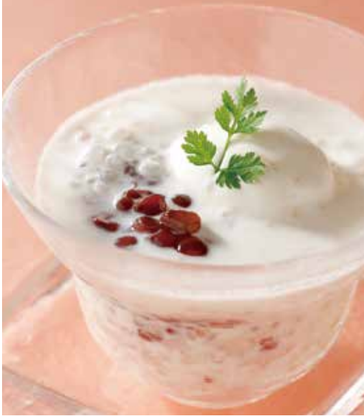
5. 西米奶露雪糕 ..... 900 (税込 990) Coconut milk with tapioca and ice cream タピオカのココナッツミルク、 アイスクリーム添え ※フルーツまたは小豆からお選びください。