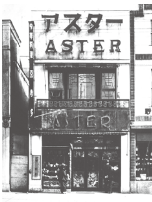
創業店舗(1926年 銀座一丁目)