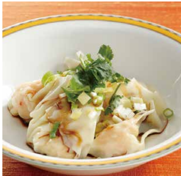
6. 蒸蝦仁雲吞 ..... 4個 800 Steamed shrimp wonton (税込 880)

カリッと香ばしく揚げた海老ワンタンを まろやかなマヨネーズクリームソースでお召し上がりください。