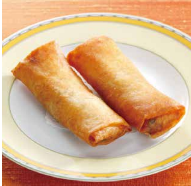
4. 炸春卷 ..... 1本 400 Spring rolls (税込 440)

蟹の爪下肉のまわりに海老のすり身を巻き、香ばしく揚げました。 時代を超えてお客様の人気を集める名物点心です。