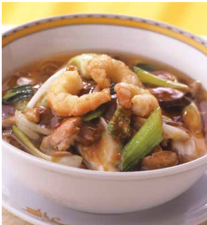
1. 亜寿多麺 ..... 2,000 Aster special soup noodles (税込 2,200)