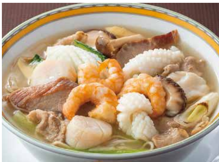
2. 什錦湯麺 ..... 2,500 Soup noodles with sautéed pork, seafood and vegetables (税込 2,750)

アスター麺は昭和33年生まれ。ブレンドした秘伝の味噌を使った濃厚でまろやかな味わいが人気です。