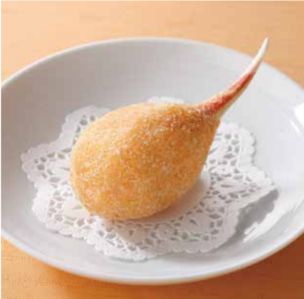
3. 百花釀蟹钳..... 1本 1,100 Fried stuffed crab claw (税込 1,210)