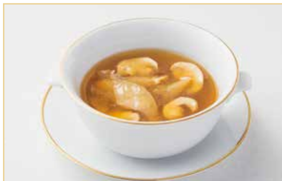
ふかのひれとマッシュルームのスूप、ポルチーニの香り 1名様用 3,000円(税込 3,300円)

きのこのうまみたっぷりの塩味ベースのあんがカリッとした麺によく絡みます。 ※麺は焼いた麺または揚げた麺からお選びください。