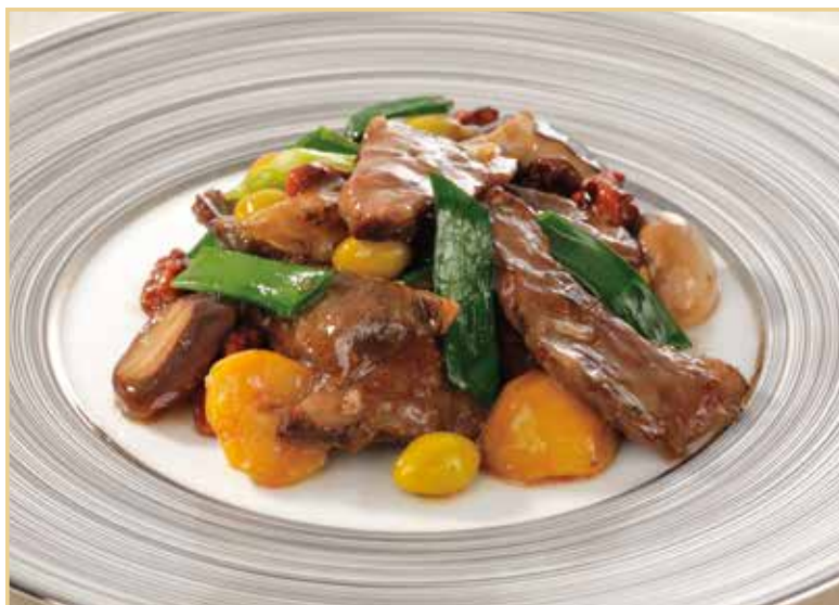
国産合鴨と秋の味覚の八宝菜 3,000円(税込 3,300円)

合鴨に、栗、鮑茸、銀杏などを取り合わせた秋ならではの八宝菜です。 合鴨の旨味、季節の素材の香りをお楽しみいただけます。