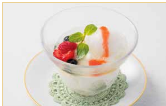
ライチーシャーベットとやわらか杏仁のパフェ 1,100円(税込 1,210円)

牛肉と揚げ豆腐を、ポルチーニが豊かに香るソースで煮込み、コクのある味わいに仕上げました。寒い季節にぴったりのお料理です。