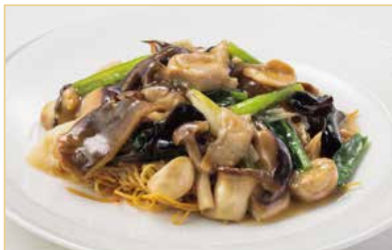
七種きのこの焼きそば 2,800円(税込 3,080円)

合鴨に、栗、鮑茸、銀杏などを取り合わせた秋ならではの八宝菜です。 合鴨の旨味、季節の素材の香りをお楽しみいただけます。